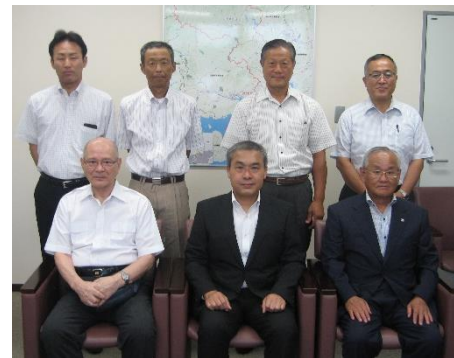
【税務署長を囲んで(署長室にて)】