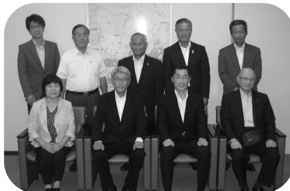
【税務署長を囲んで(署長室にて)】